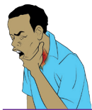
Maux de gorge