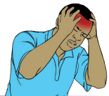
Maux de tête