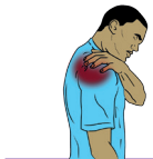
Douleurs musculaires et articulaires