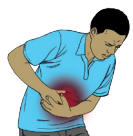
Maux au ventre